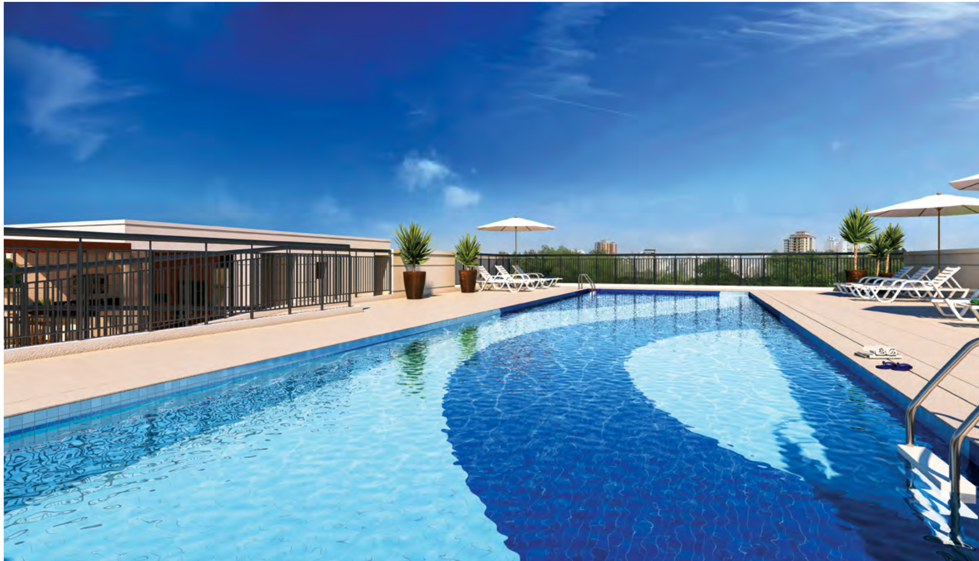
Perspectiva artística da Piscina Adulto