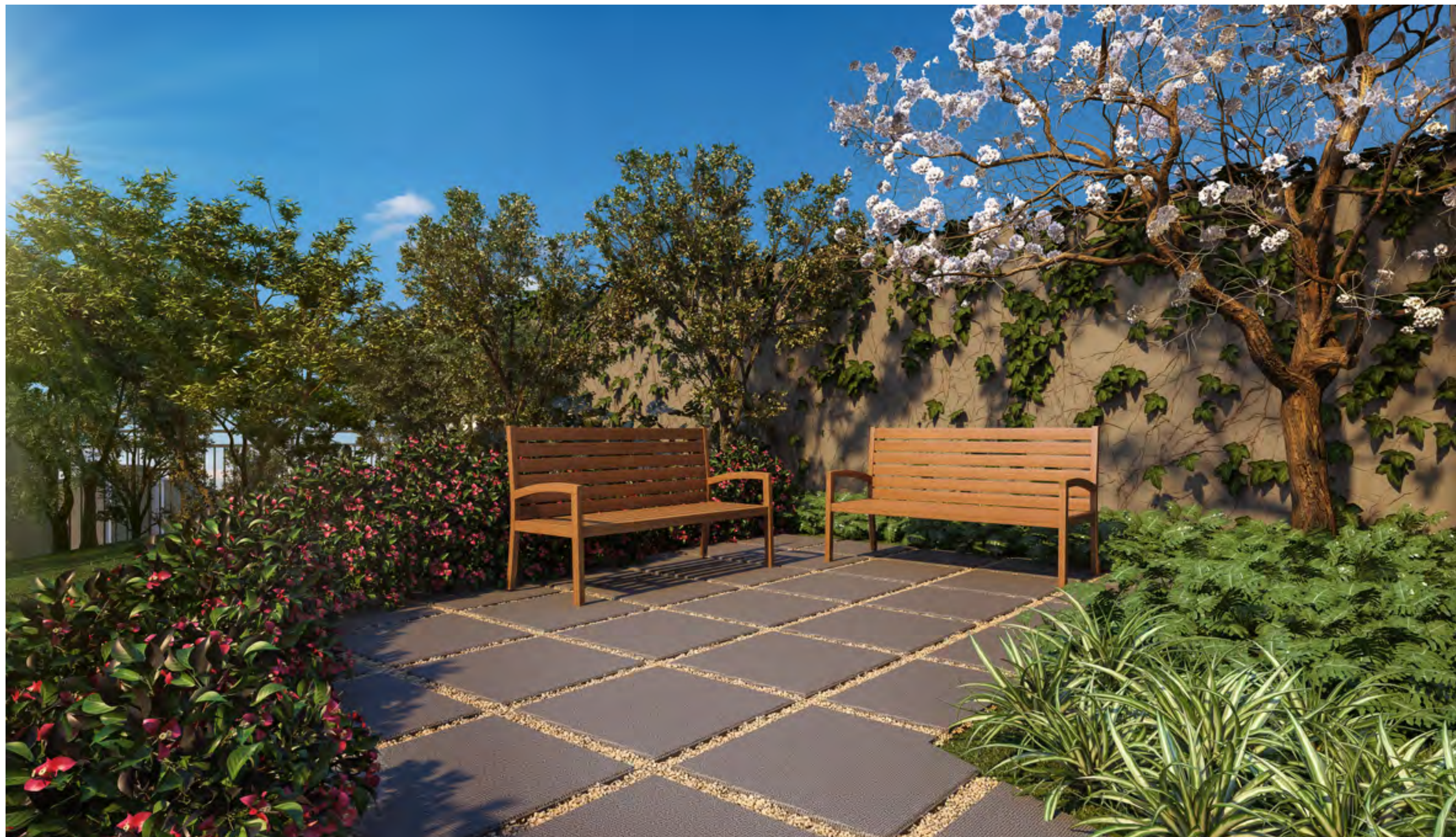
Perspectiva artística da Praça das Árvores