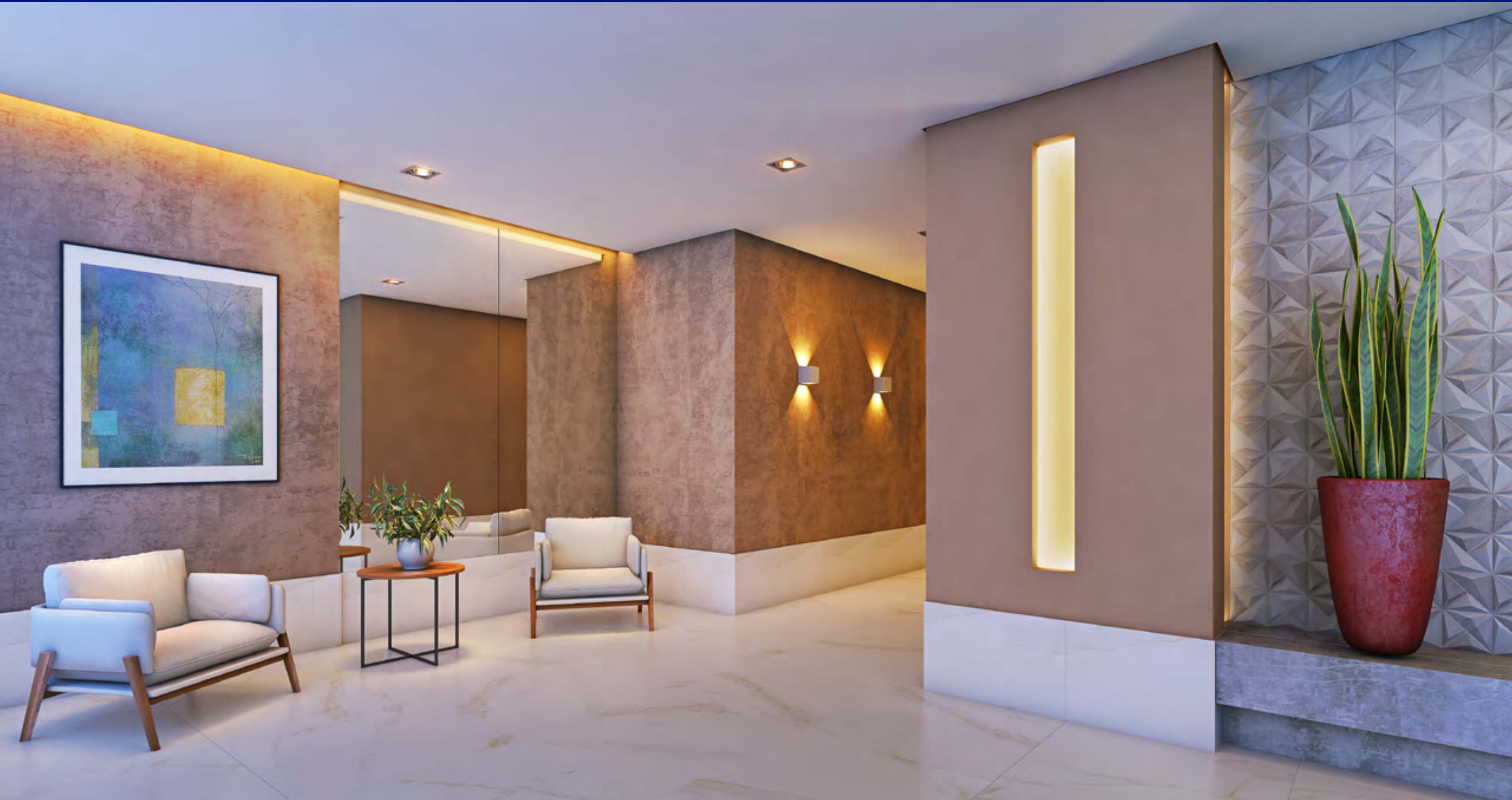
Perspectiva artística do Hall de Entrada