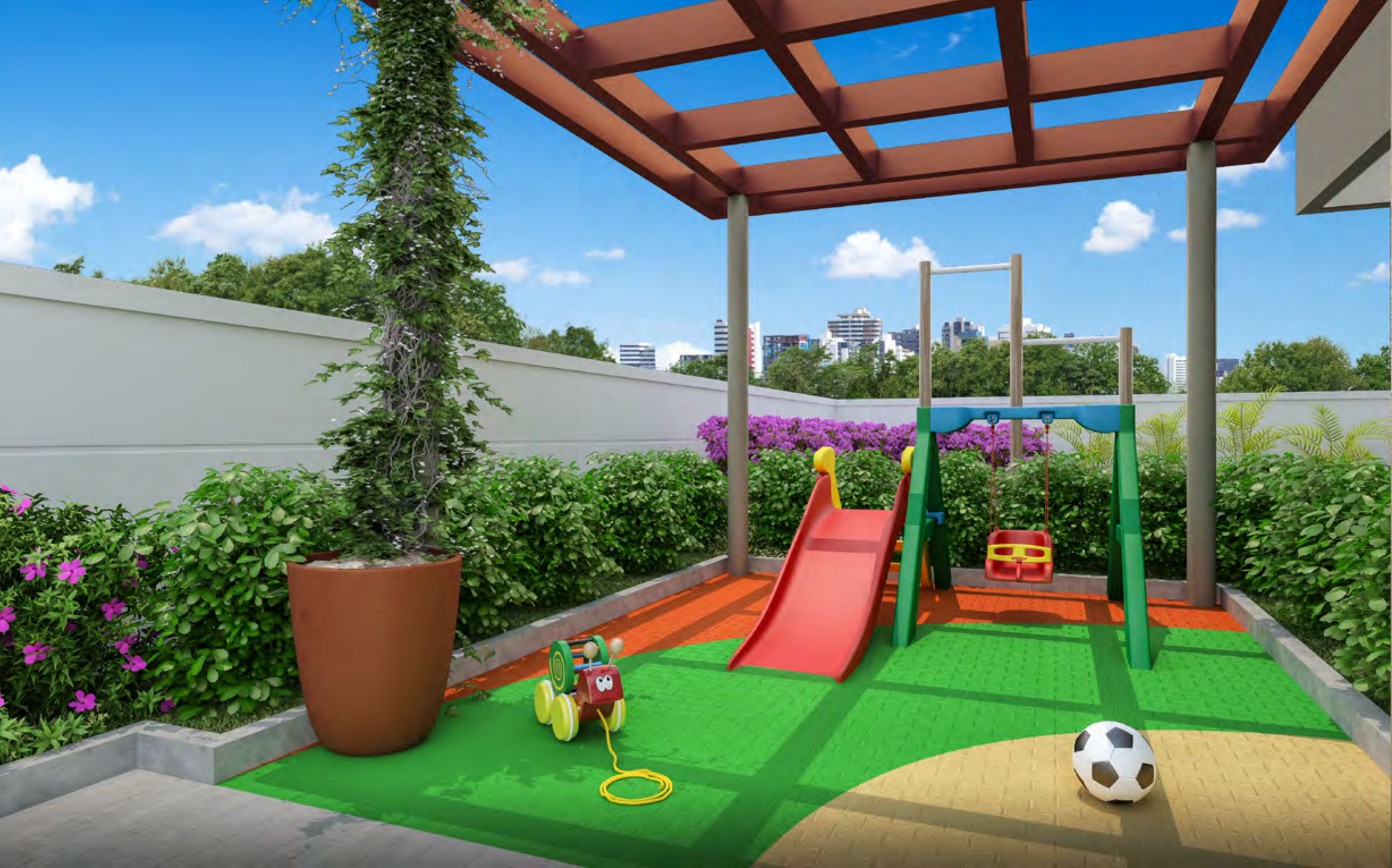
Perspectiva artística do Baby Play