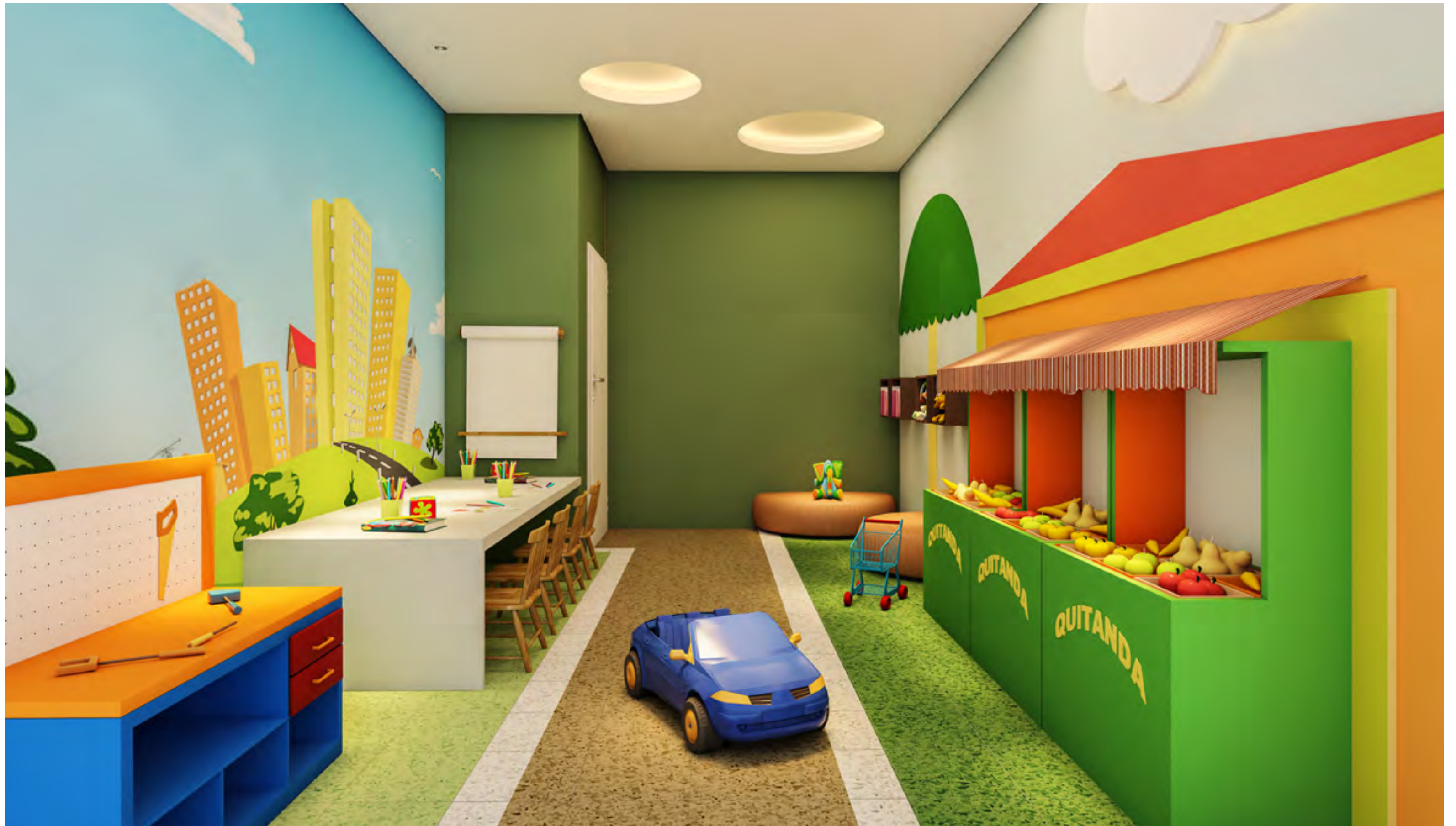
Perspectiva artística da Brinquedoteca