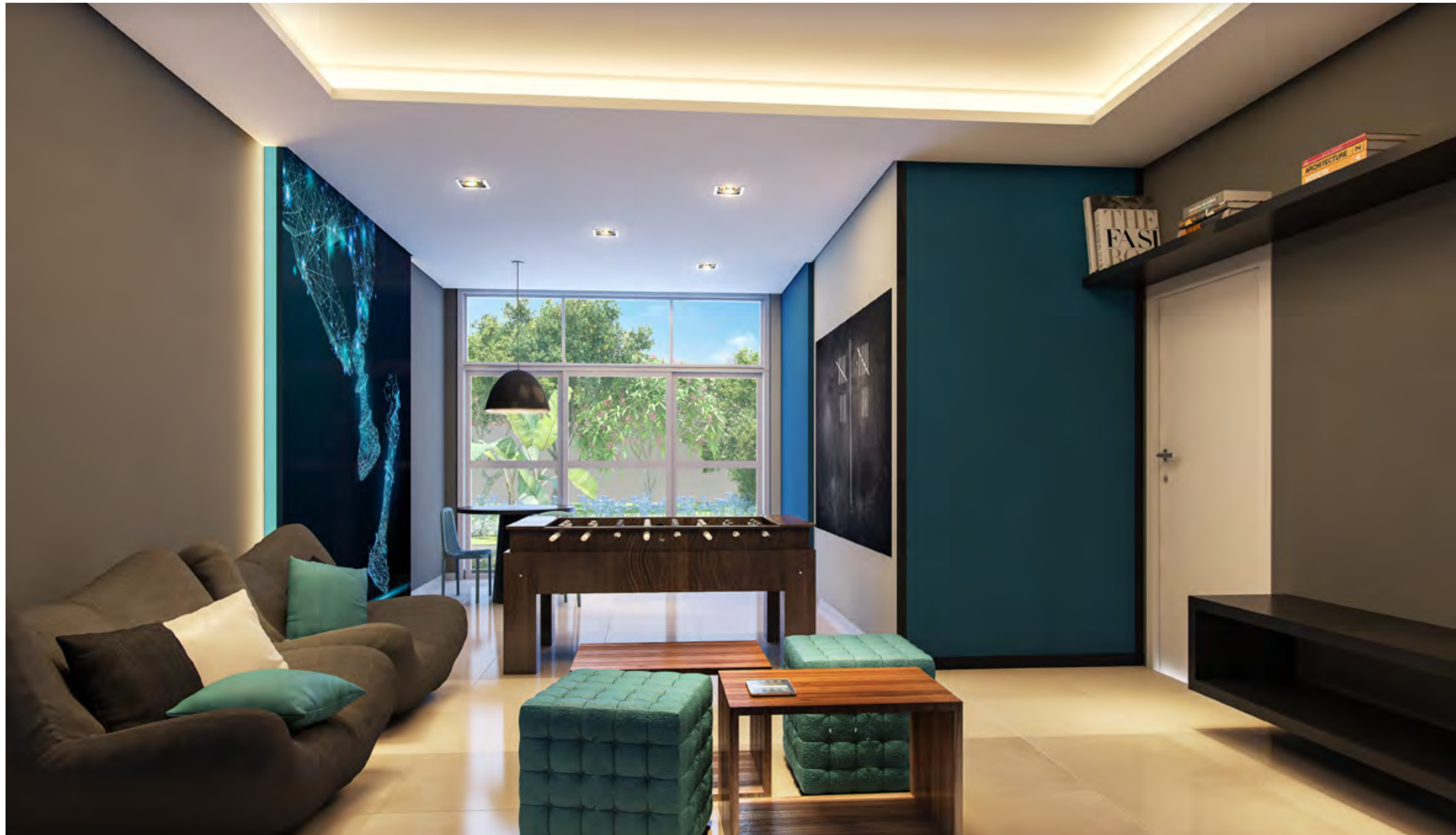
Perspectiva artística da Praça das Árvores