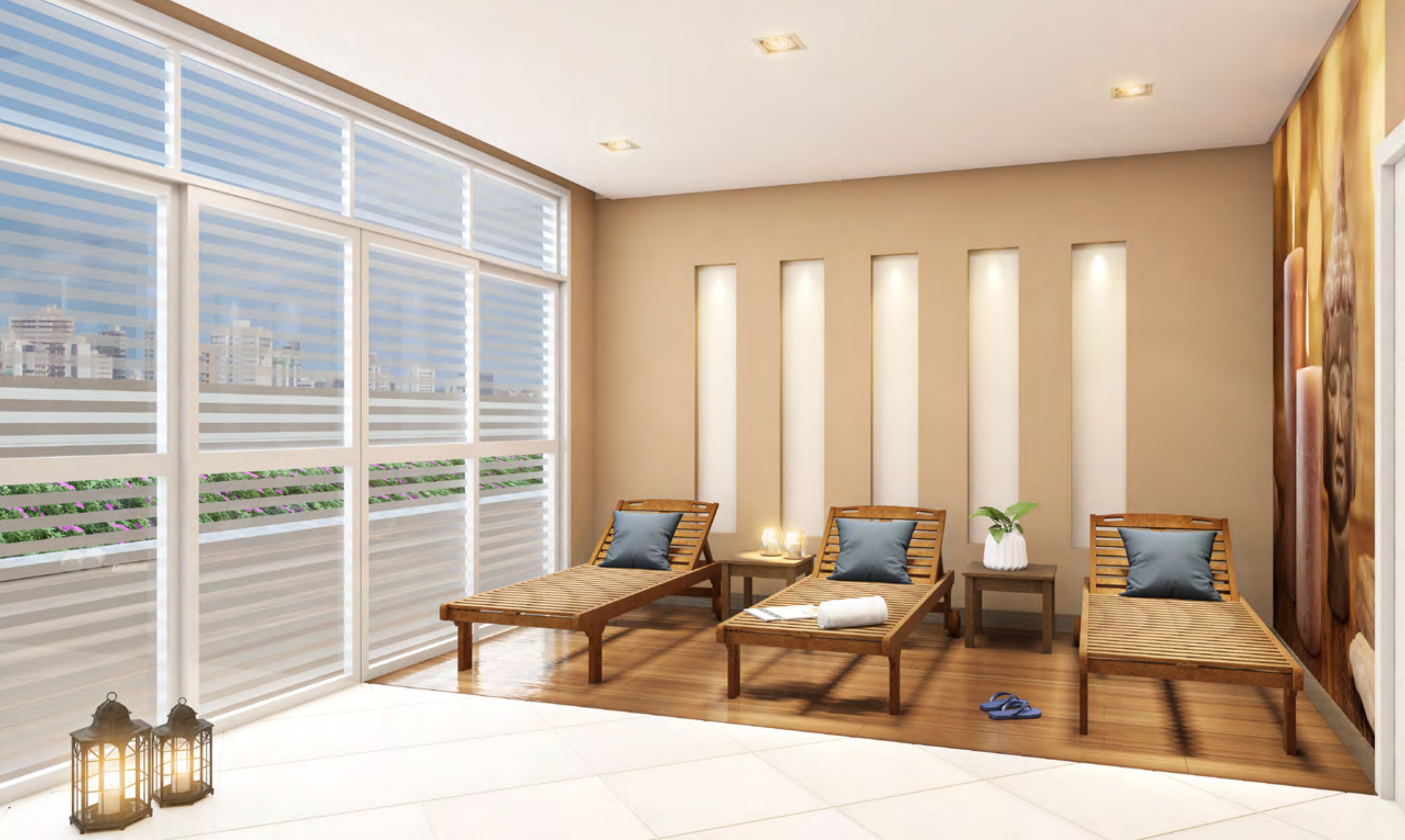
Perspectiva artística do Baby Play