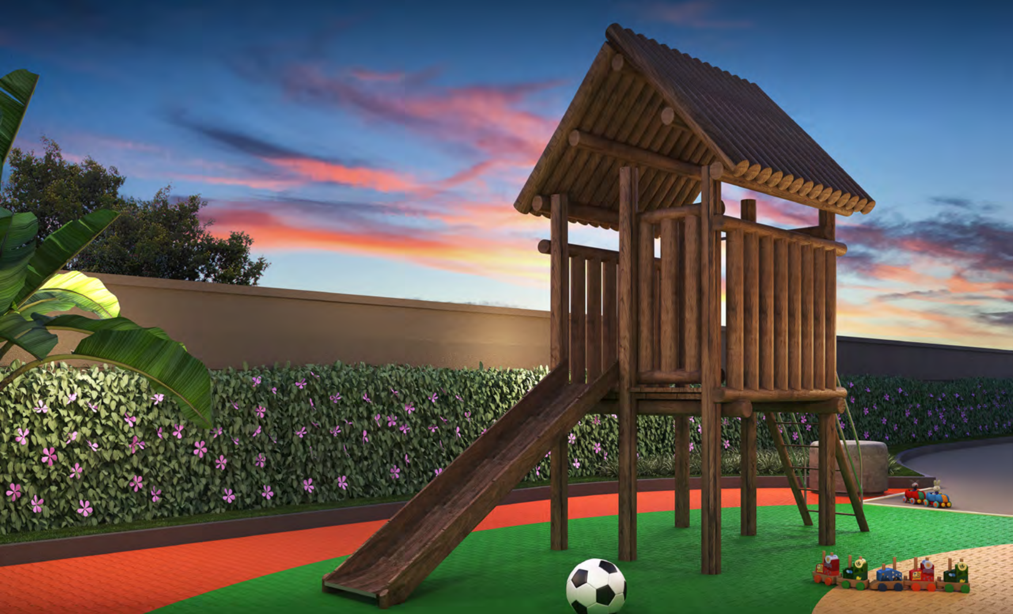
Perspectiva artística do Playground