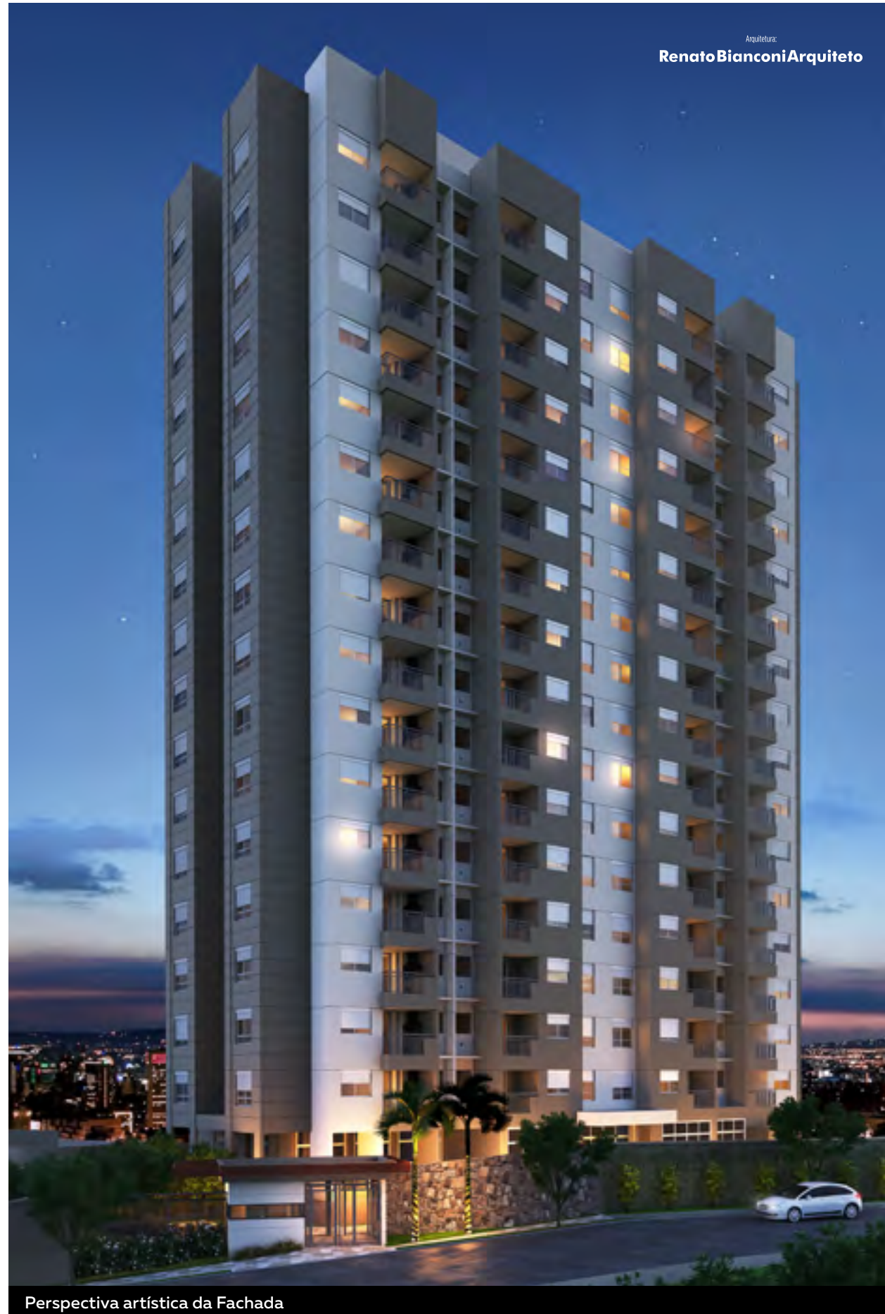
Perspectiva artística da Fachada