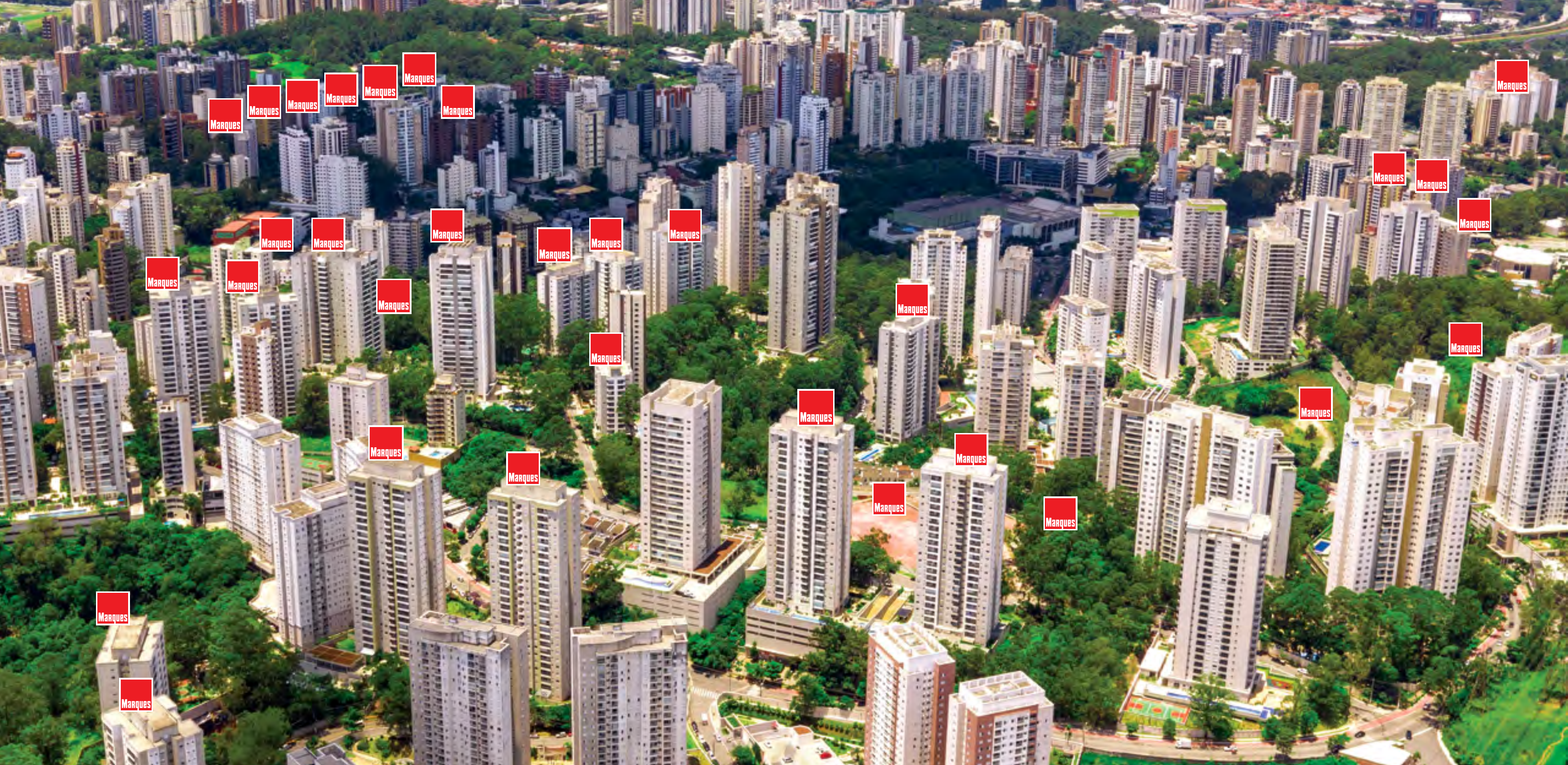
Presença da Marques Construtora na região do Morumbi

MAIS DE 8.850 APARTAMENTOS ENTREGUES RIGOROSAMENTE NO PRAZO