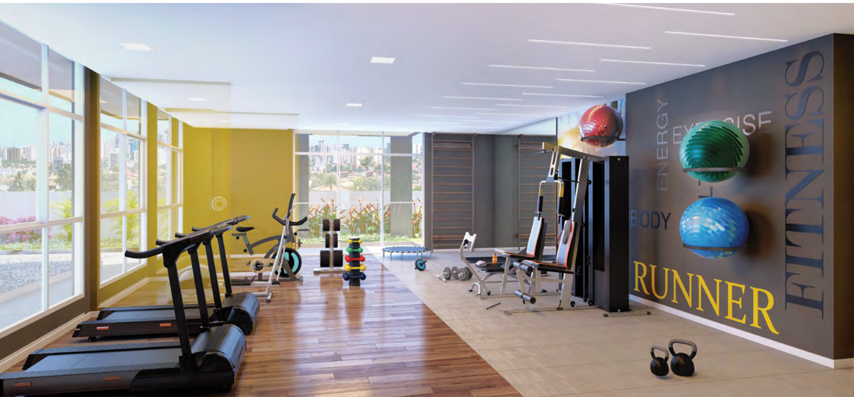
Perspectiva artística do Fitness