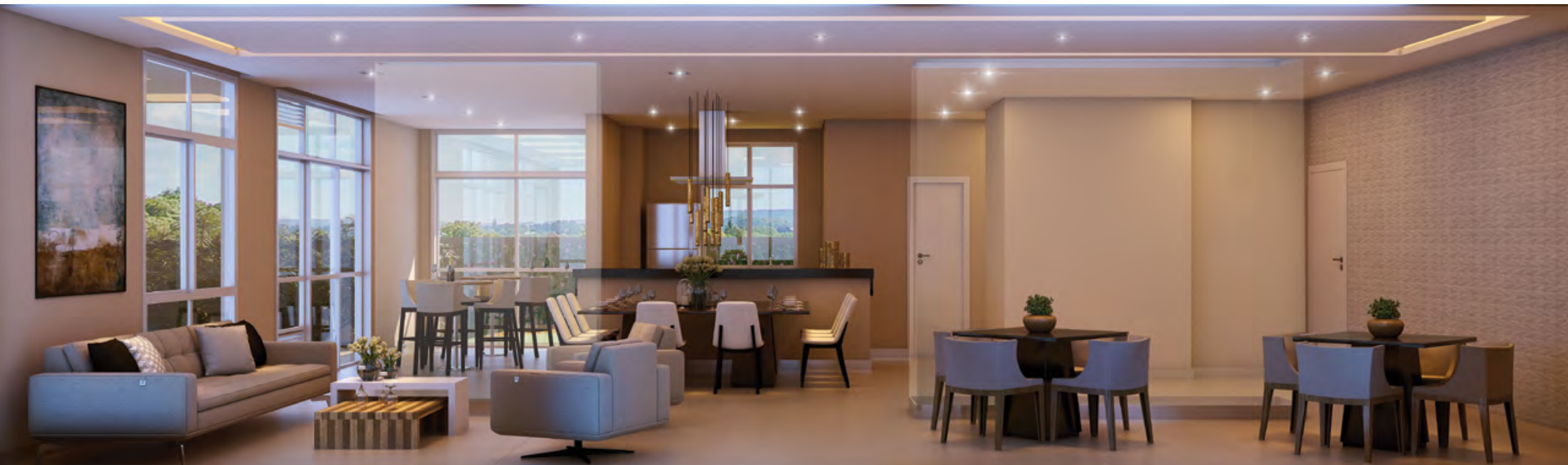
Perspectiva artística do Salão de Festas Gourmet