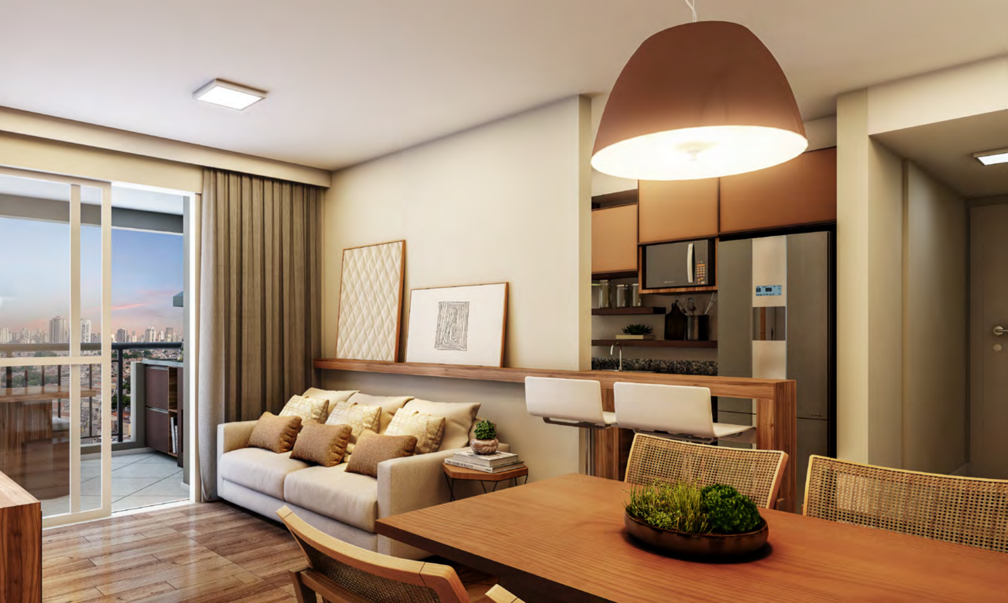
Perspectiva artística do Living do apto. de 59 m 2