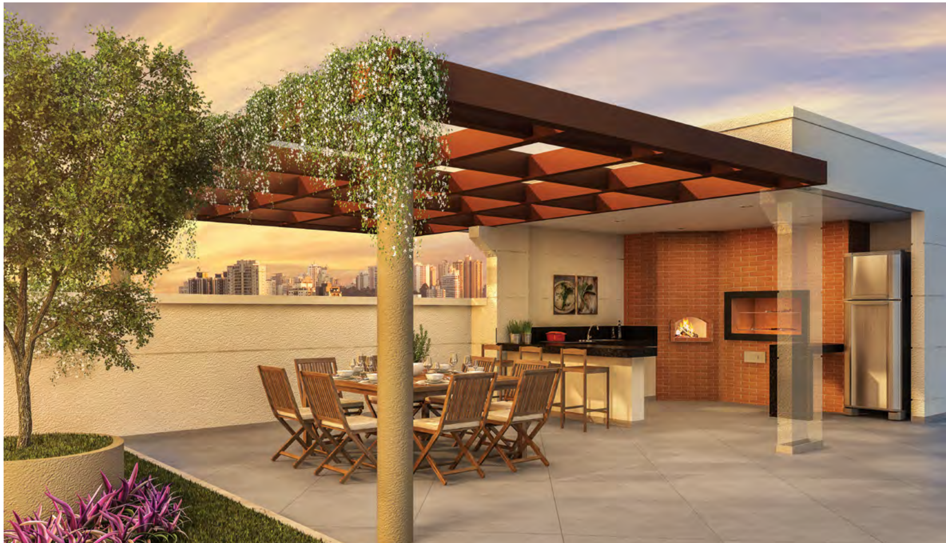
Perspectiva artística do Quiosque Gourmet com Churrasqueira e Forno de Pizza