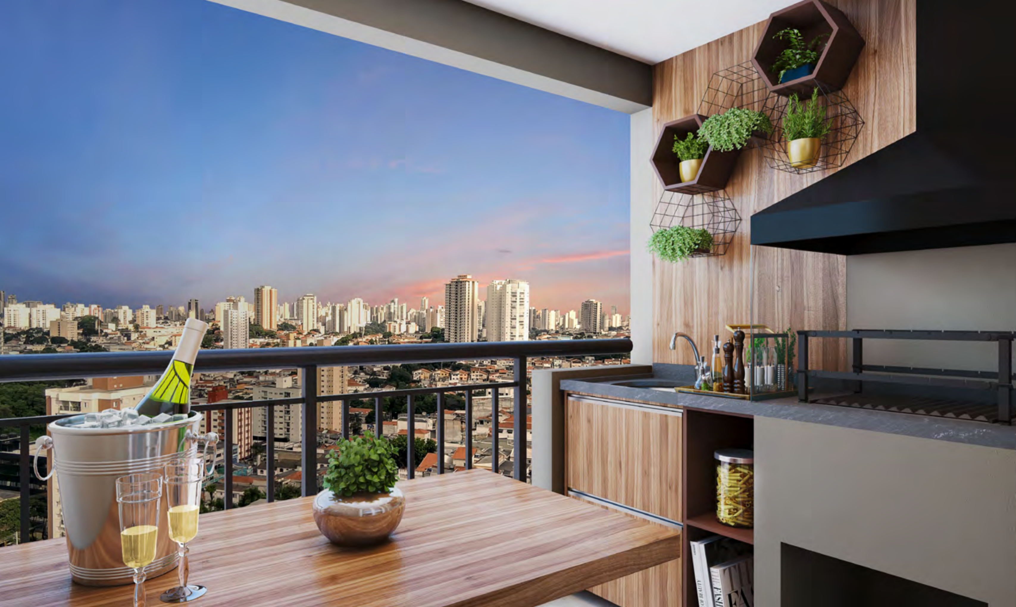
Perspectiva artística da Varanda com Churrasqueira do Apto. de 59 m 2