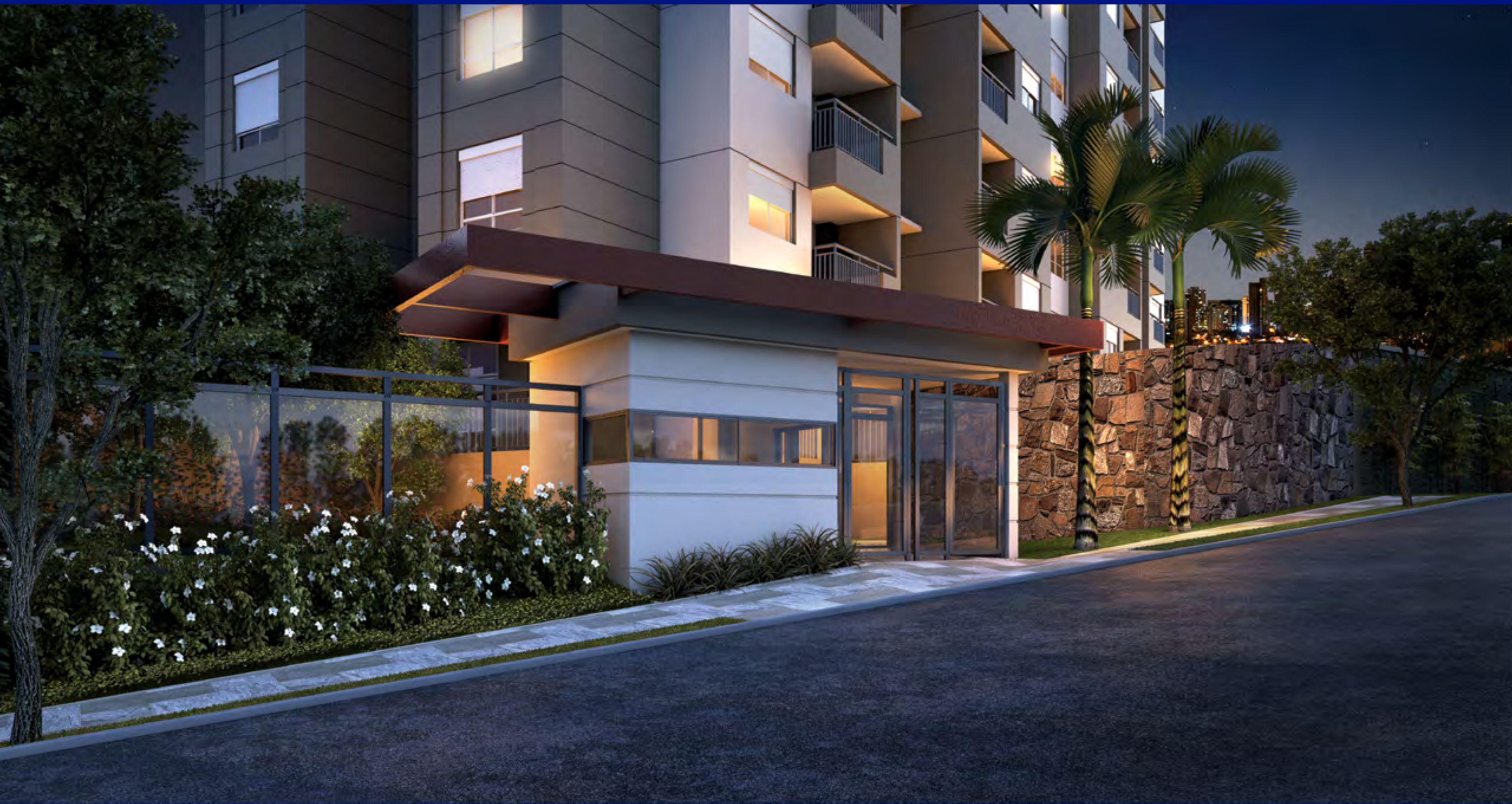
Perspectiva artística da Entrada