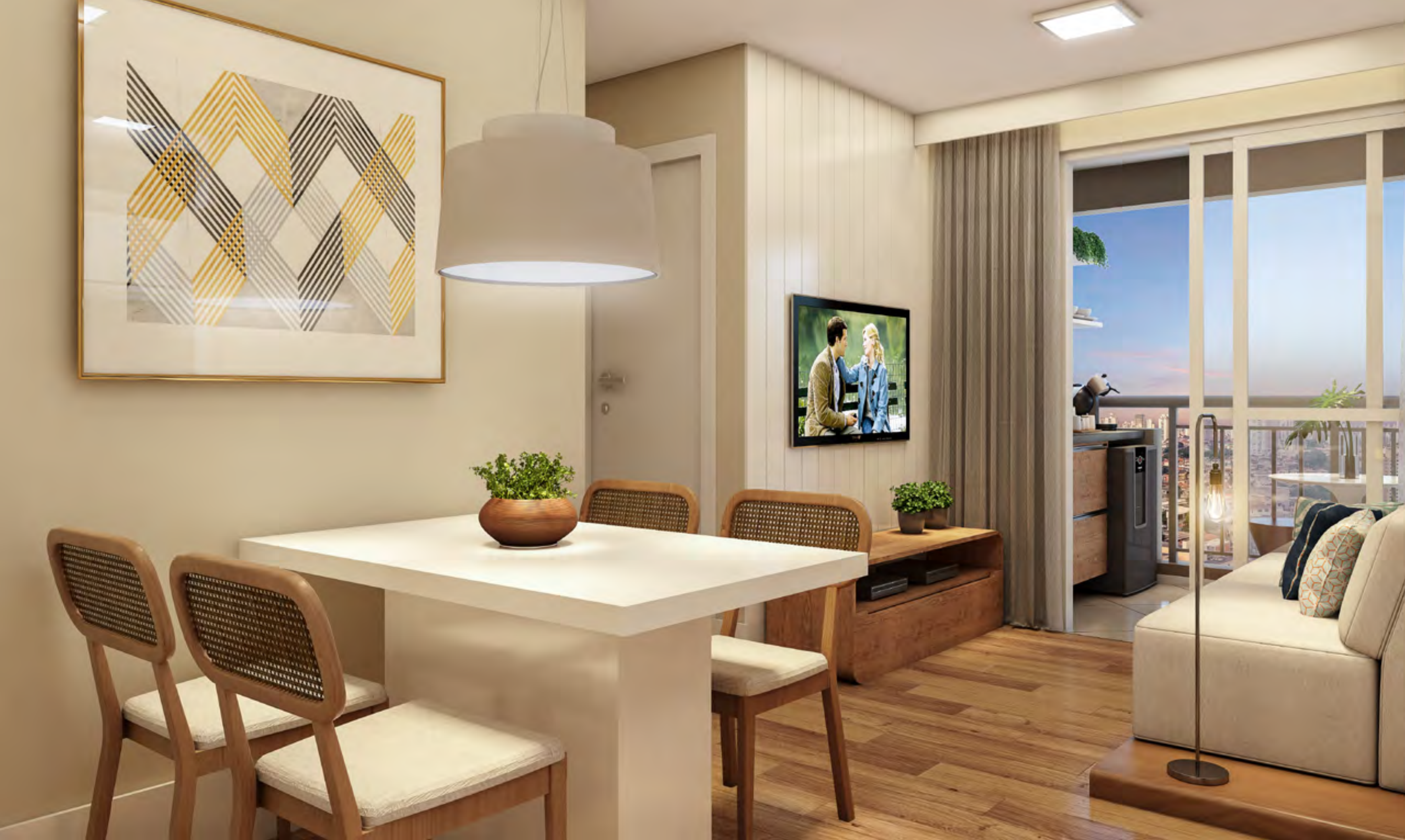
Perspectiva artística do Living do apto. de 49 m 2